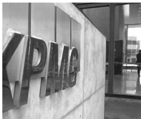
Abogados y Contadores

cierre y éxito de la operación en un menor tiempo.